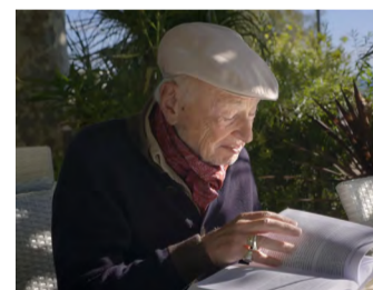
Edgard Morin à la Seyne-sur-mer, en 2020.