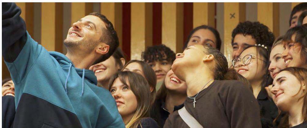
L'école en actes.

Le film, que l'ANRAT a conçu et co-produit avec la Compagnie des Indes, voyage d'un niveau scolaire à un autre pour raconter une histoire : celle d'une École où l'on apprend mieux, grâce au partenariat entre enseignants et artistes, à découvrir, à s'épanouir, à s'écouter, à partager, à s'émouvoir et à rêver ensemble. Primaire, collège, lycée et parcours professionnalisant, quatre classes distinctes voient le théâtre faire irruption dans leur quotidien. À mesure que le film progresse, le sens du collectif se renforce, et le théâtre prend une place plus importante dans la vie des élèves. Avec l'aimable participation de Philippe Torreton, Ariane Mnouchkine, Thomas Jolly, Vincent Dedienne, Julie Deliquet et Emmanuel Demarcy-Mota. Plus qu'une célébration de 40 ans d'action de l'ANRAT, il s'agit de réfléchir ensemble au devenir de la place du théâtre à l'École.