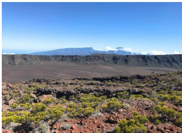
Caverne des Lataniers