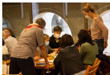
Rencontre avec Gaël Faye à une masterclass du PRÉAC Chanson Francophone et Musiques Actuelles au mois de juillet 2021